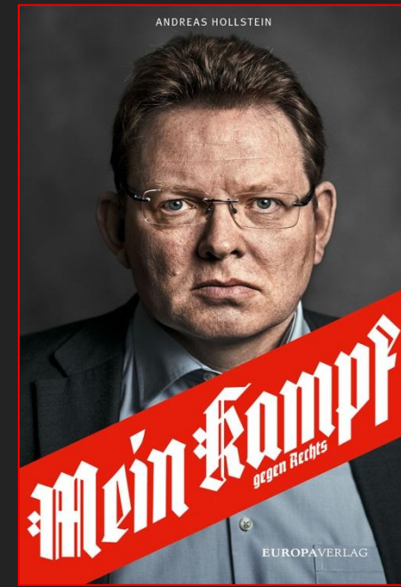
Andreas Hollstein Bürgermeister

Deutsches Theater - Schumannstraße 13 A - 10117 Berlin